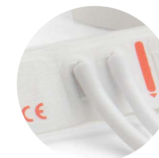
Neugeborenen-Einmalmanschette Zwei Schläuche