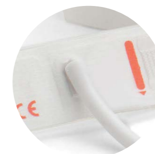
Neugeborenen-Einmalmanschette Ein Schlauch